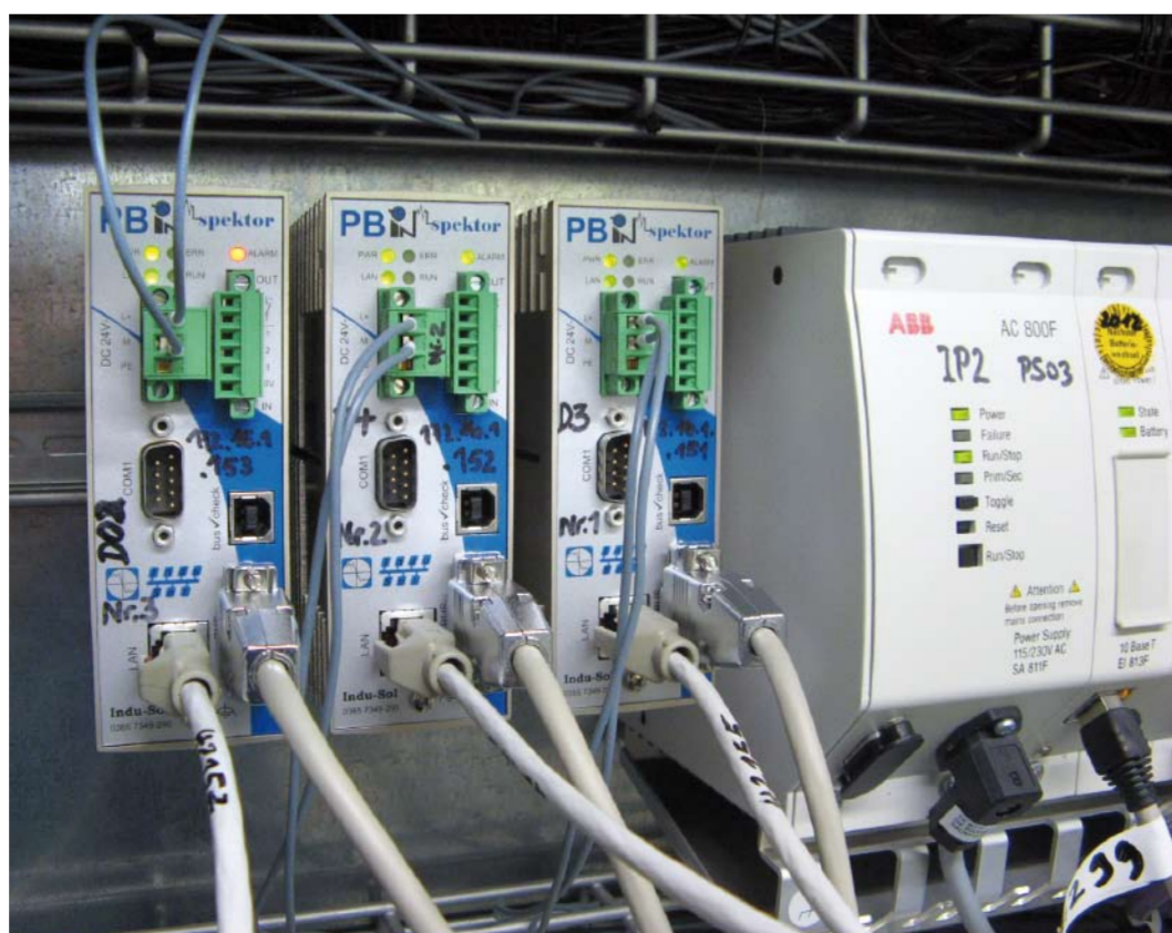
Abb. 1: Profibus-INSpektoren im Praxisbetrieb

werte werden mit einem Zeitstempel versehen und bis zu 365 Tage minutenaktuell in einer Datenbank gespeichert. Die Alarmierung der Instandhalter erfolgt bevor die logische Busqualität den sicheren Bereich verlässt. Die Möglichkeit der Integration über „OPC“ in bestehende Visualisierungen und der Fernzugriff über „VPN“ sind wichtige Bestandteile dieser Systemlösung zur permanenten Netzwerküberwachung.