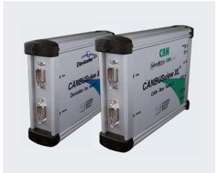
Bild 1 - Qualitätstester CANBUSview XL