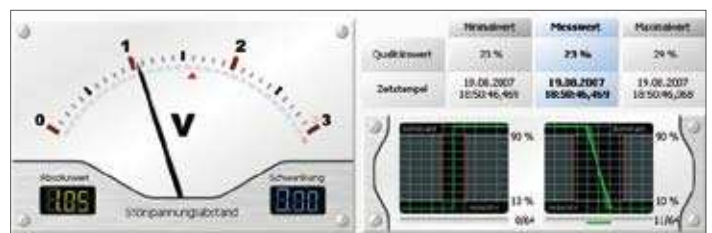
Bild 3 - Einzelmessung