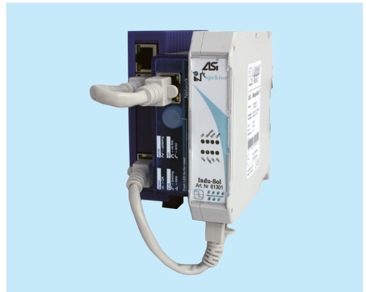
ASI-INSpektor® mit Webinterface (StarterKIT)