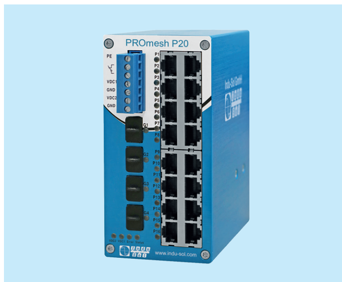
PROFINET Switch PROmesh P20