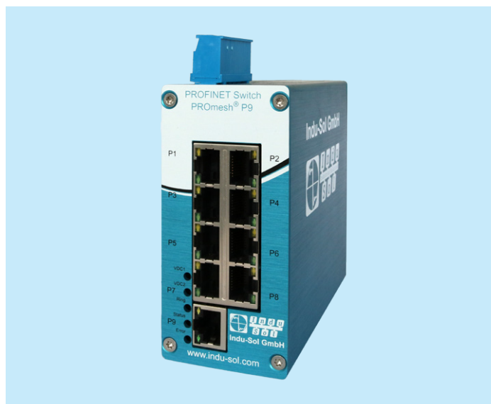
PROFINET Switch PROmesh P9