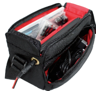
Transporttasche mit integrierter Anschlussöse