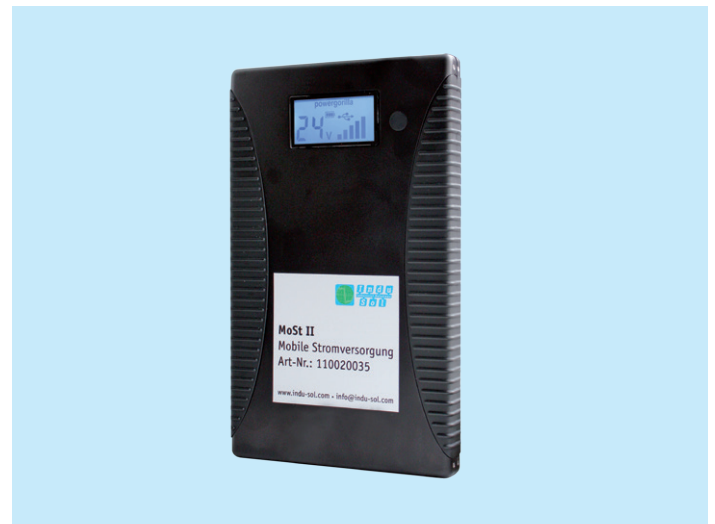
Mobile Stromversorgung MoSt II